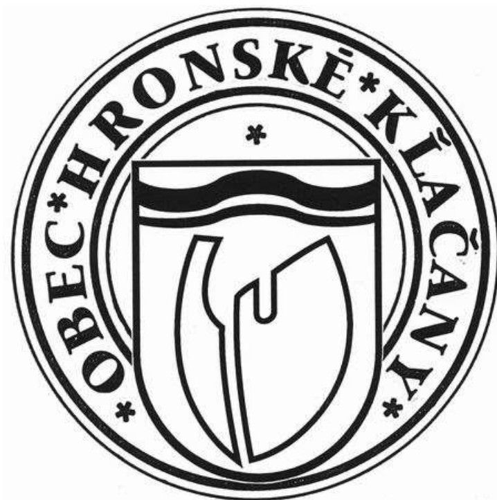
Pečiatka obce Hronské Kľačany