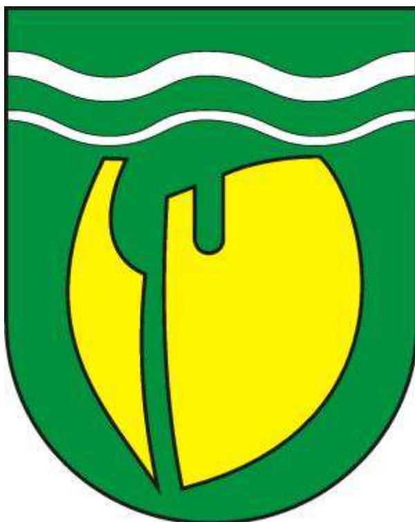
Erb obce Hronské Kľačany